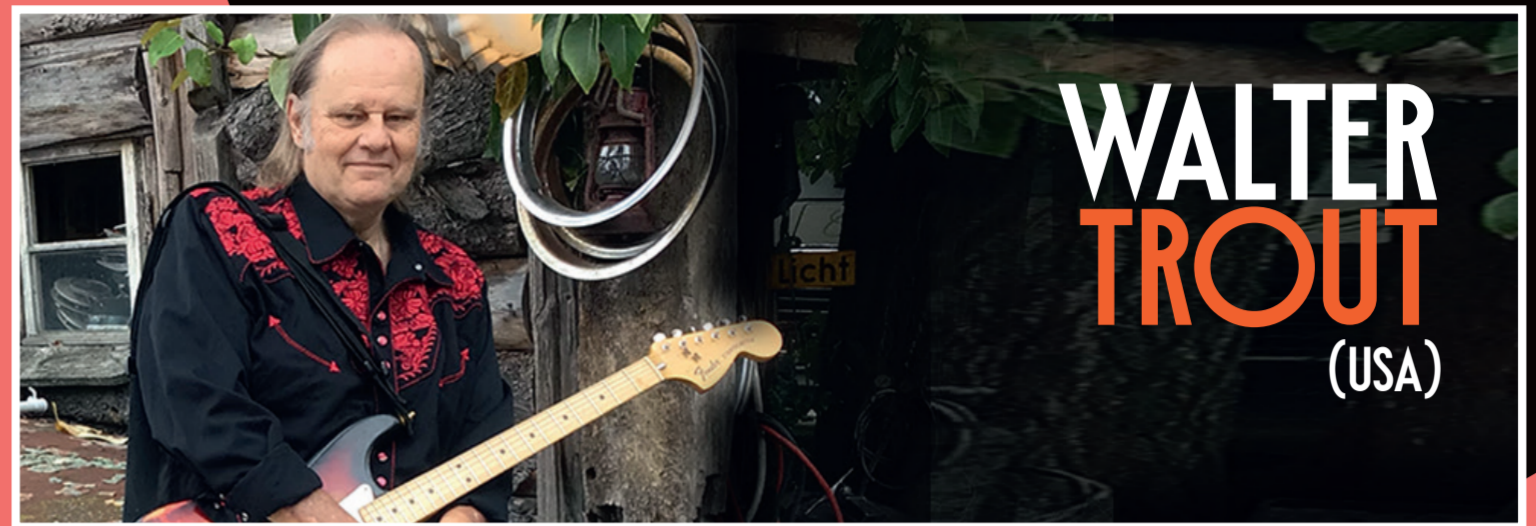
WALTER TROUT (USA)