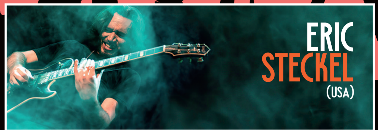
ERIC STECKEL (USA)