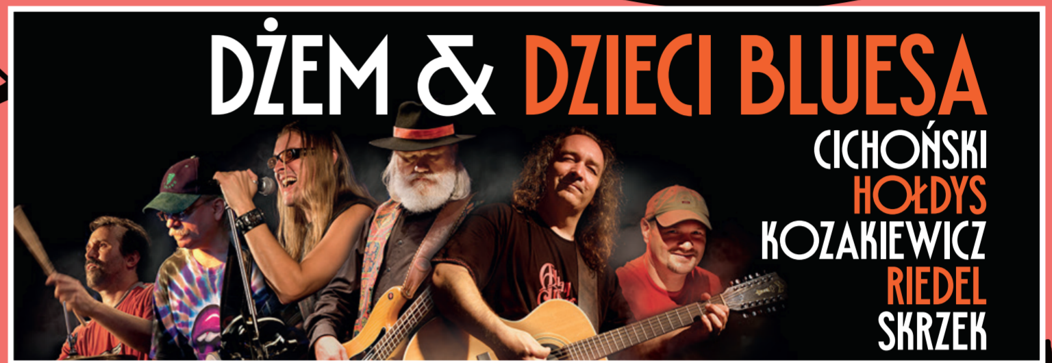
DŻEM & DZIECI BLUESA CICHOŃSKI HOŁDYS KOZAKIEWICZ RIEDEL SKRZEK