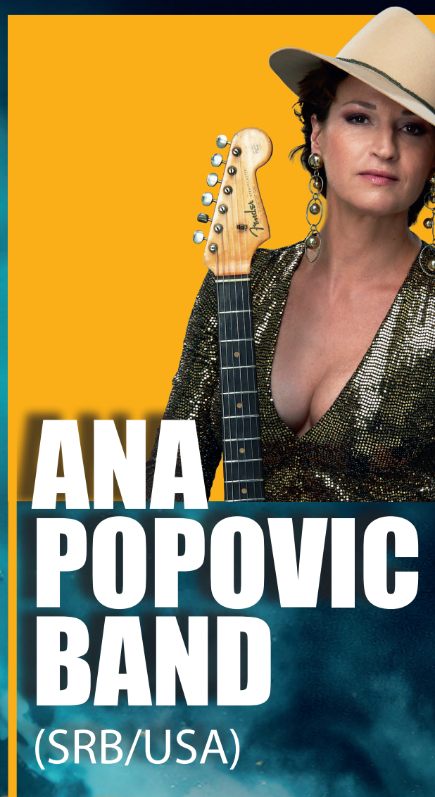
ANA POPOVIC BAND (SRB/USA)